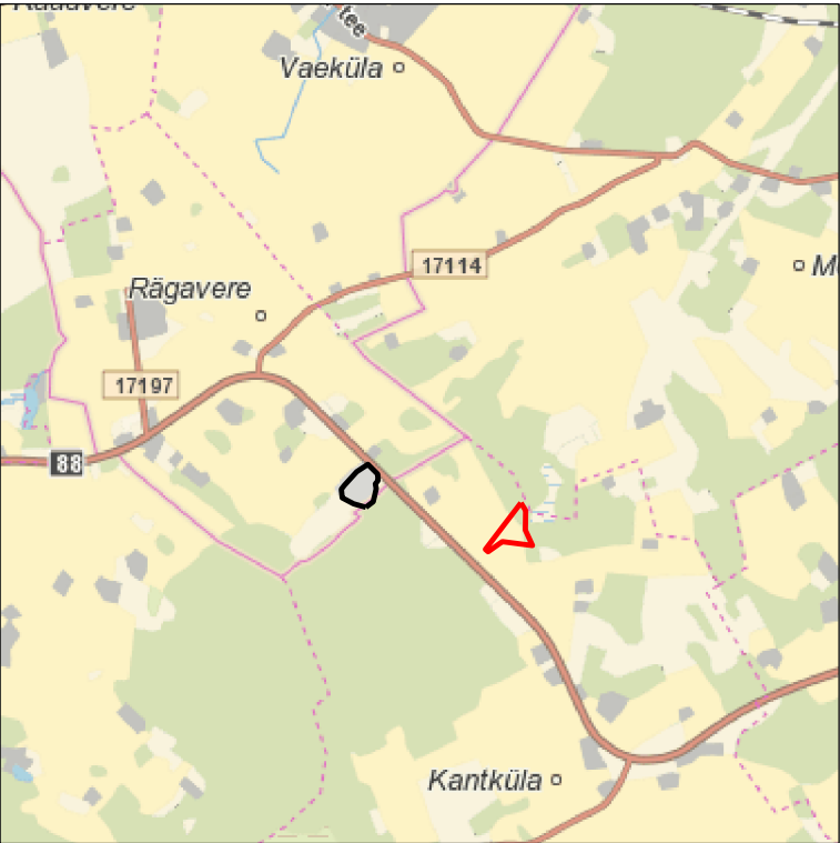
Kaardileht nr 6434 Rakvere